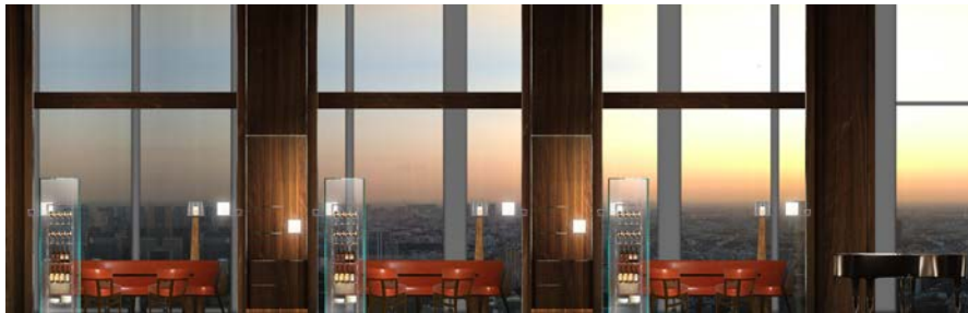
51階 アンダーズ タヴァーンからの眺望