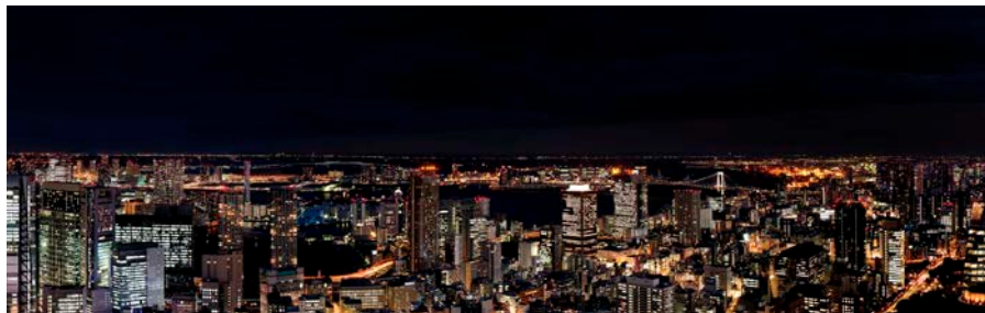
52階 ルーフトップバーからの眺望