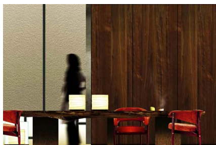
51階 アンダーズ ラウンジ